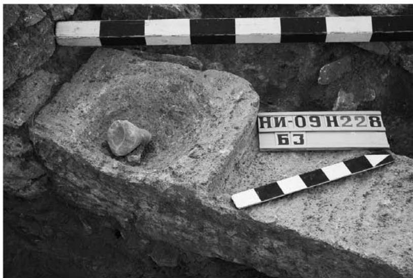
Рис. 2. Илуратское плато. Ножка синопской амфоры III–II вв. до н. э. в позднеантичном или раннесредневековом святилище