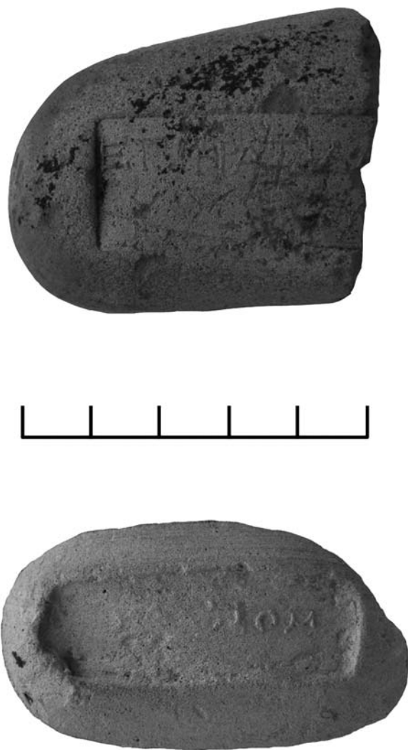
Рис. 5. Некрополь Китея. Юго-западный участок. Сколы-окатыши ручек родосских амфор II в. до н. э. из погребально-поминального комплекса IV в. н. э.