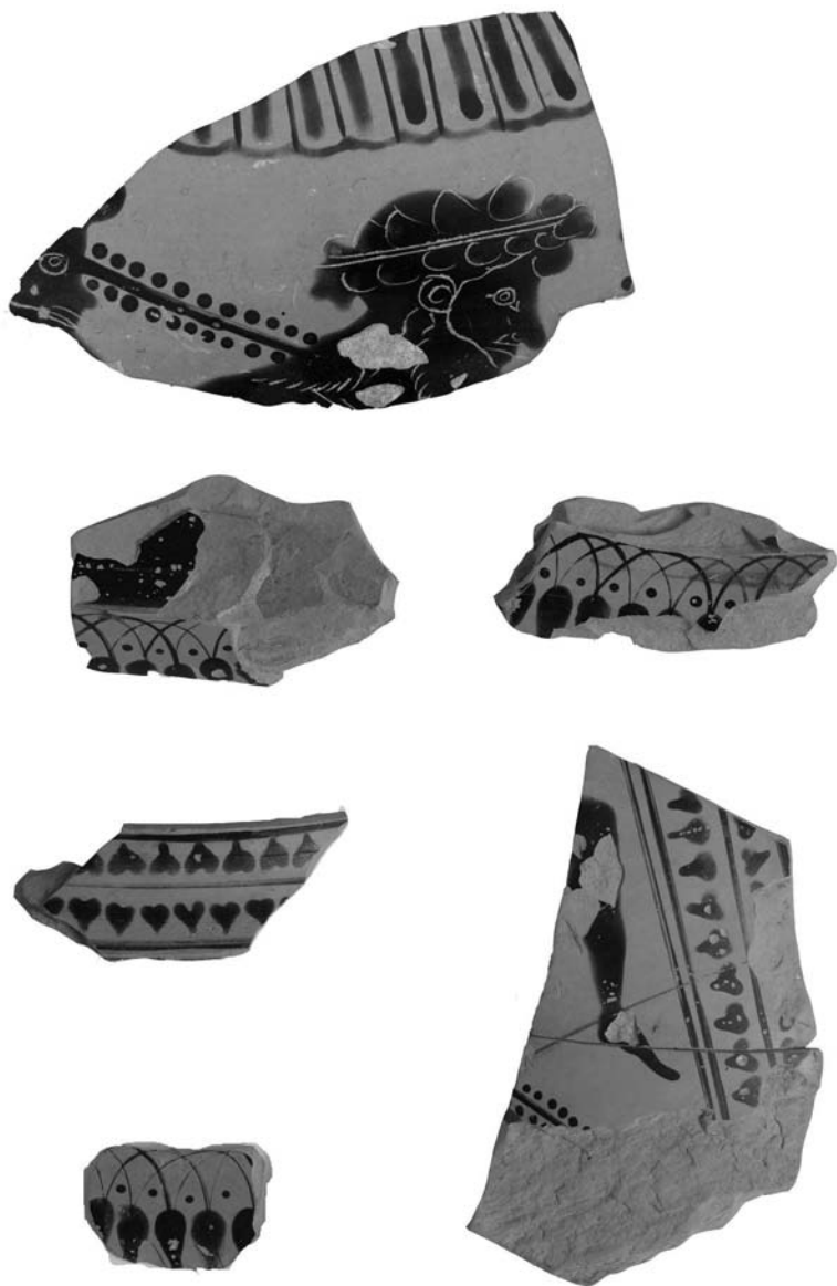
Рис. 4. Некрополь Китея. Фрагменты чернофигурного кратера последней четверти VI в. до н. э. из тризны первых веков н. э.