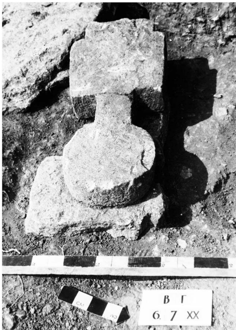
Рис. 3. Некрополь Китея. Антропоморфное изваяние III в. до н. э. в перекрытии могилы № 109 I–II вв. н. э.