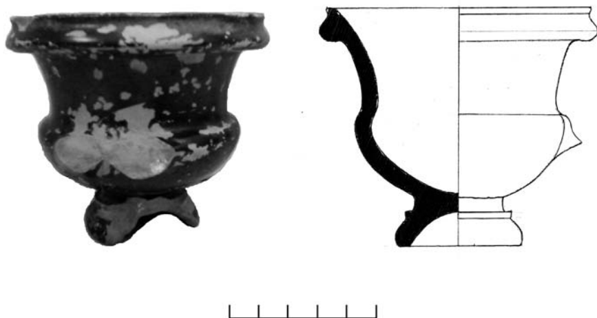
Рис. 1. Илуратское плато. Чернолаковый канфаровидный килик IV в. до н. э. из могилы № 129, I в. н. э.

Выделение вещей и/или объектов, принадлежащих иной (более древней) культуре, иной технологической традиции, и использование их в собственных ритуалах не случайно и не может быть объяснено исключительно утилитарными соображениями. Скорее, это связано с особенностями и потребностями архаического мифоритуального типа мышления, присущего боспорянам, как и всем представителям традиционных обществ [Тульпе, 2012, с. 13–38].