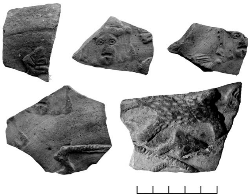
Рис. 6. Некрополь Китея. Юго-западный участок. Фрагменты рельефного сосуда с дионисийским сюжетом из тризны IV в. н. э.