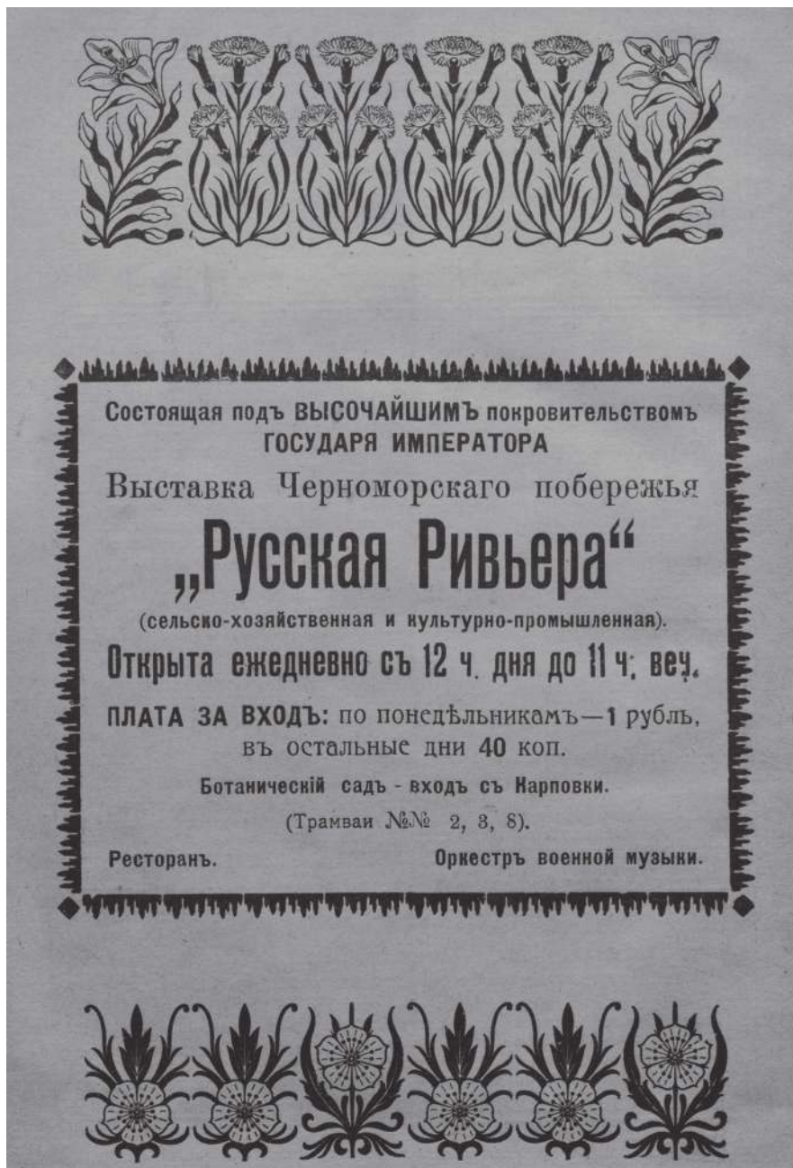
Рис. 1. Объявление о выставке в прессе // «Русская Ривьера», сельскохозяйственная и культурно-промышленная выставка Черноморского побережья Кавказа. Обзорение Выставки Черноморского побережья Кавказа «Русская Ривьера»: Императорский Ботанический сад. Санкт-Петербург. Ноябрь-декабрь 1913 г. Санкт-Петербург: Александр Ходнев, 1913. С. 19.