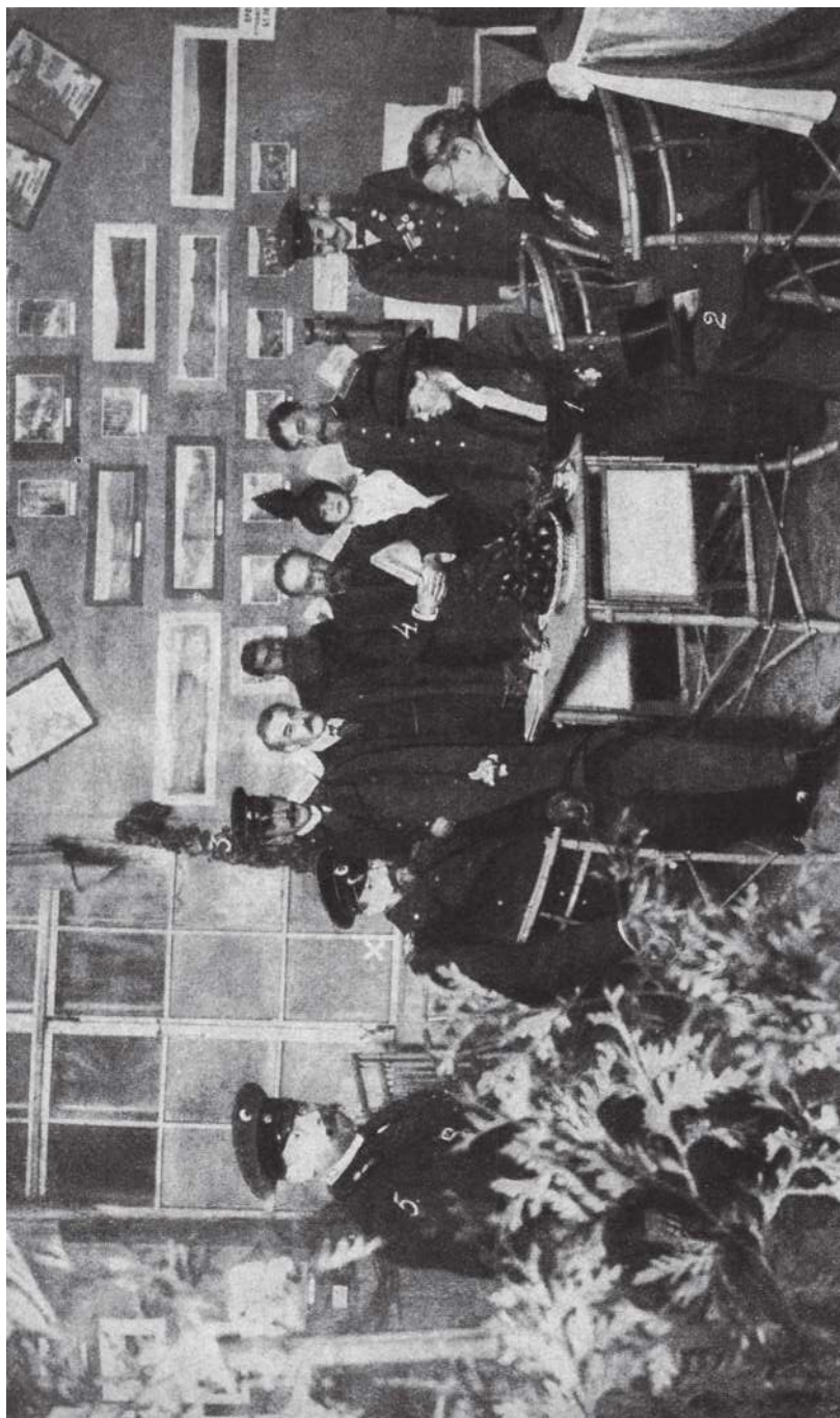
Рис. 2. Его Императорское Высочество Великий Князь Александр Михайлович и Ее Императорское Высочество Великая Княгиня Ольга Александровна (1) в павильоне Чаквинского удельного именина пробуют русский удельный чай.

Среди присутствующих: 2) статс-секретарь А. С. Ермолов; 3) адъютант Великого Князя Александра Михайловича капитан 1-го ранга Н. Ф. Фогель; 4) генеральный комиссар выставки Н. И. Воробьев; 5) д. с. с. В. А. Старовский // Огонек. 1913. 15 (28) декабря № 50. С. 3.