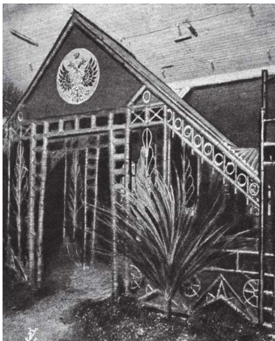
Рис. 6. Павильон чайных плантаций удельного имения «Чаква» // Огонек . 1913. 17 (30) ноября № 46. С. 6.