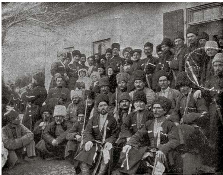
Рис. 13. Группа лиц, принимавшая участие во Веденских торжествах и переехавшая в Артуры на открытие школы [Боговитин, 1913, с. 13].

отмечал начальник округа: «в широком более или менее объеме» [РГИА, ф. 1320, оп. 1, д. 241, л. 25]. Перед торжеством проводились панихиды во всех храмах, синагогах и мечетях. Сам юбилей был ознаменован крестным ходом и военным парадом. Вечером город был иллюминирован и скромно украшен флагами. С помощью синемаграфов и утренних чтений, администрация знакомила население с «историческими моментами царствования дома Романовых». Администрация округа отличилась при этом большим числом ходатайств о переименовании имеющихся сооружений. В пример можно привести переименования Хасавюртовского округа в «Алексеевский» округ, слободу Хасав-Юрт в слободу «Алексеевскую», наименование начальной школы для «детей туземцев» «школой-пансионом имени Наследника Цесаревича Великого князя Алексея Николаевича» и другие. В течении нескольких дней были устроены чтения «с туманными картинками по особой юбилейной программе для учащихся местных школ церковно-приходской Лютеранской, кумыкской / сунитской / персидской / шиитской / и еврейской». После чтений всем учащимся были розданы юбилейные брошюры и портреты царских особ. В Грозненском и Хасавюртовском округах население участвовало в мероприятиях, но начальники в отчетах не раскрыли подробностей.