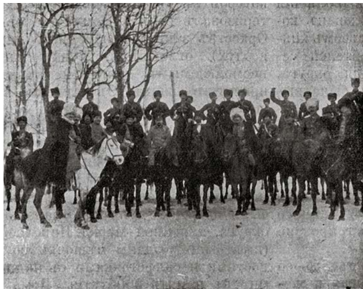
Рис. 11. Перед выездом в Артуры на открытие школы Шейх-Балат Гирея [Боговитин, 1913, с. 13].