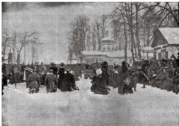
Рис. 5. Молебен на площади перед парадом [Боговитин, 1913, с. 12].

исполнением лезгинкой чеченки в национальных нарядах [Боговитин, 1913, с. 13]. Бал закончился в пять утра, но торжество продолжалось и далее.