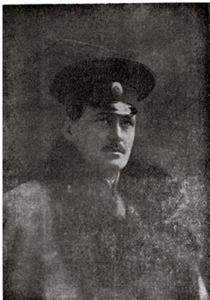
Рис. 1. Начальник Веденского округа князь Соломон Георгиевич Каралов [Боговитин, 1913, с. 12].

для представлений о памяти и отношении горцев к российской власти [Дзахова, Бязрова, 2014, с. 34]. В день празднования 300-летнего юбилея династии Романовых все учреждения и дома были украшены «национальными» флагами. Не смог автор статьи не похвалить начальника округа князя С.Г. Каралова (рис. 1), его способности, с помощью которых он сумел «вселить в горцах любовь, веру и уважение к себе, как представителю русской власти» [Боговитин, 1913, с. 12].