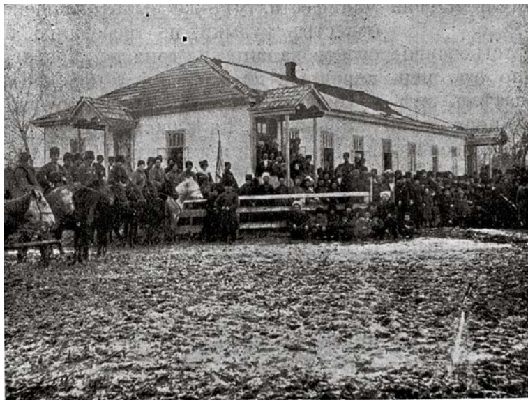
Рис. 12. Школа в ауле Артуры [Боговитин, 1913, с. 13].

вместе с этим молодежь производила джигитовки и скачки» [РГИА, ф. 1320, оп. 1, д. 241, л. 57]. В Хасавюртовском округе праздновали трехсотлетний юбилей менее пышно чем в Грозненском. Только в слободе Хасав-Юрт проводились мероприятия, как