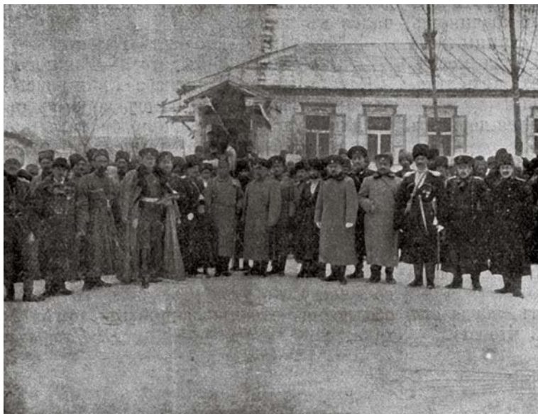
Рис. 2. «Начальник округа князь Каралов читает проект телеграммы с выражением верноподданических чувств» [Боговитин, 1913, с. 12].